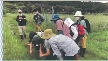
長ノ山湿原における 保全活動について