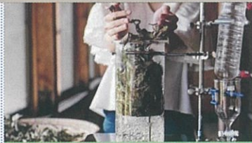
東栄町の地域文化の魅力を伝える 森林アロマと多様性のある森づくり