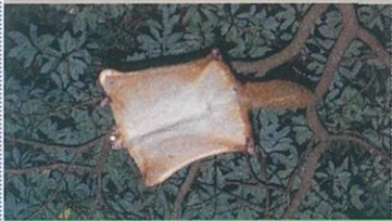
奥三河地域における ムササビの生息状況